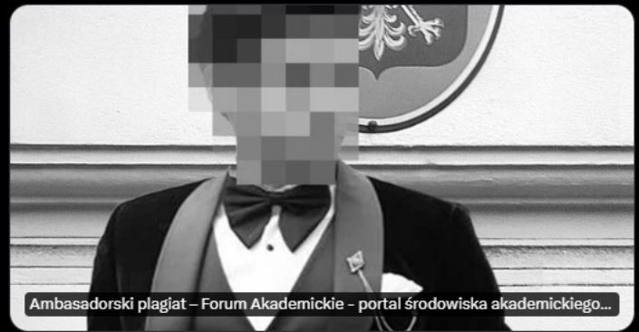
Ambasadorski plagiat – Forum Akademickie – portal środowiska akademickiego... Ze strony miesiecznik.forumakademickie.pl