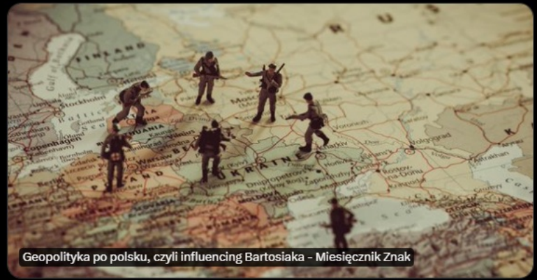
Geopolityka po polsku, czyli influencing Bartosiaka - Miesięcznik Znak

Youtubowa gawęda geopolityczna stała się ostatnio głównym źródłem wiedzy o sprawach międzynarodowych. Na zaproszenie @MiesiecznikZNAK napisałem artykuł "Awatary geopolityki", biorąc na warsztat twórczość @PiotrZychowicz i @BartosiakJacek.